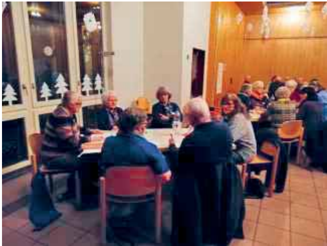
Diskussionsrunden am Workshop im Februar

In einem Bericht wurden die Ergebnisse zusammengefasst und Empfehlungen zuhanden der politischen Behörde abgegeben, die über das weitere Vorgehen entscheiden wird. Sie ist dafür zuständig, zusammen mit den Akteuren im Altersbereich geeignete Massnahmen zu definieren und umzusetzen. Zudem werden die Ergebnisse auch in das regionale Altersleitbild einfliessen, das im Moment erarbeitet wird und Biglen Teil davon ist.