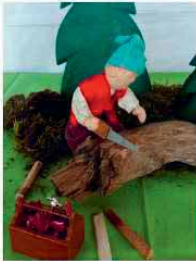
«I bi ds Zwärgli Ibida, cha saage win e starche Ma.»