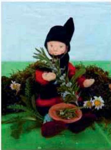
«I bi ds Zwärgli Zipfeliwitz, mit em fiine Nasespitz.»