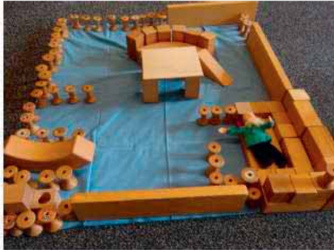
«I bi ds Zwärgli Zwickubei u wär am liebschte geng dahei.»