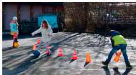
Zwei jüngere Mädchen nehmen am Fussball-Kurs eines älteren Kindes teil.