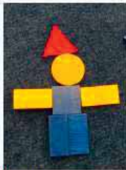
Zwerge legen - Wohnungen bauen