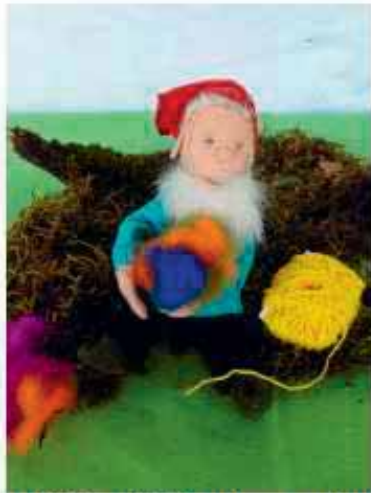
«I bi ds Zwärgli Wulezart u han e länge wysse Bart.»