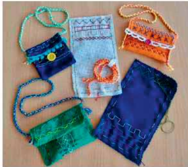
nähen - sticken - Kordel drehen - filzen