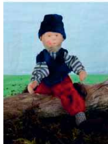
«I bi ds Zwärgli Hopsassa u cha höch gumpe, lueget da.»