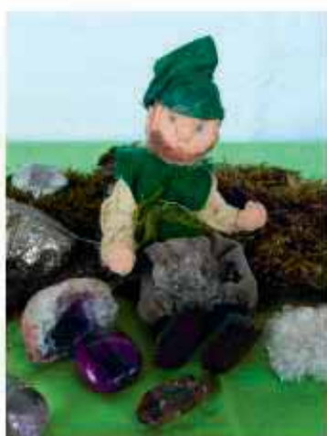
«I bi ds Zwärgli Houderihei u finge geng die schönste Stei.»