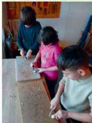
Zwei jüngere Kinder nehmen am Kurs «Zwerge schnitzen» teil.