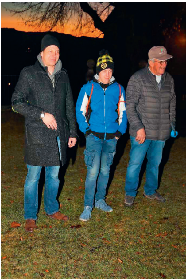
Drei Generationen der Familie Bichsel. Einer alten Tradition folgend, läuten sie jeweils das Silvesterspiel der Musikgesellschaft Biglen ein.