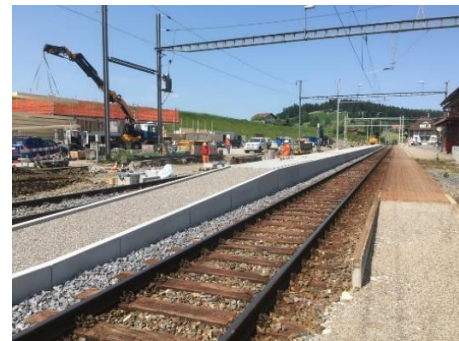
Neuer Mittelperron mit Zugangsrampe

oder über unser Kontaktformular auf bls.ch/kundendienst