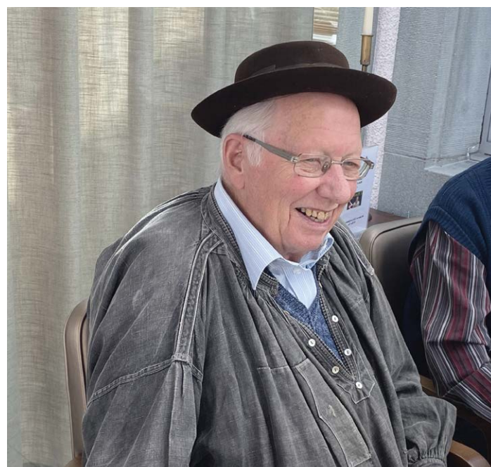
Seniorenfasnacht im Februar