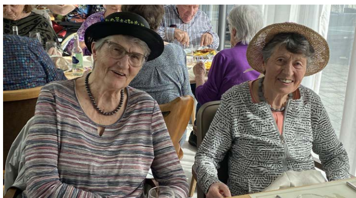
Rückblick vom Seniorenessen im Februar 2023