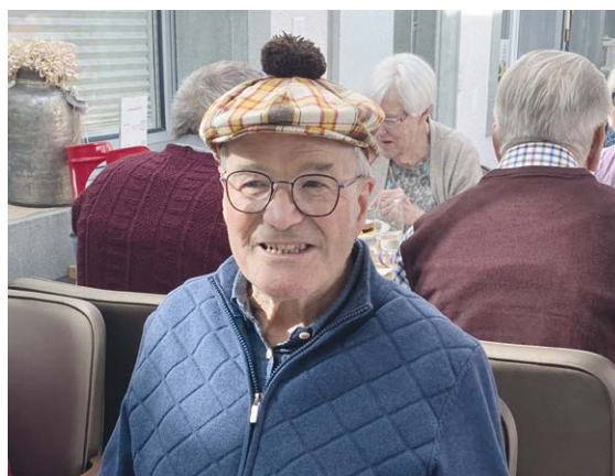
Seniorenfasnacht im Februar