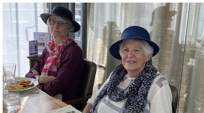
Fasnacht bei den Senioren