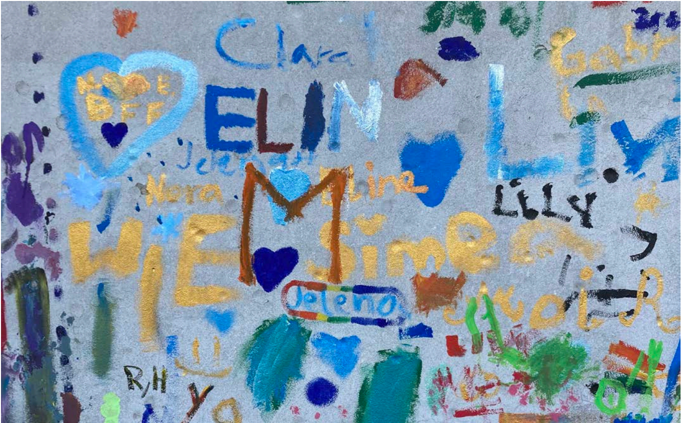
Vergängliches Kunstwerk von Schülerinnen und Schülern an der Aussenwand der Turnhalle