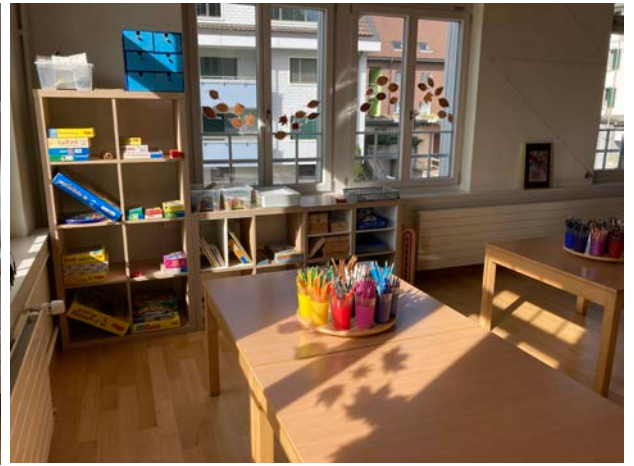
Die im Sekschulhaus eingezogenen Kindergärten stehen bereit