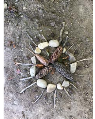
Spielmorgen 2023 im Wald – Kunst und Spass standen im Zentrum