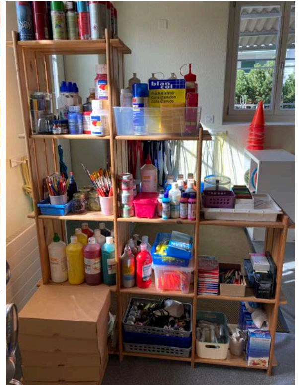
Auch im neu geschaffenen Malatelier wird in der nächsten Zeit viel Kreatives entstehen

Der Sportunterricht aller Klassen verteilt sich in der Zeit bis zur Fertigstellung des Neubaus auf die Espace-Arena , auf vermehrte Alternativen im Freien, sowie Besuche auf der Eisbahn und im Schwimm- und Hallenbad.